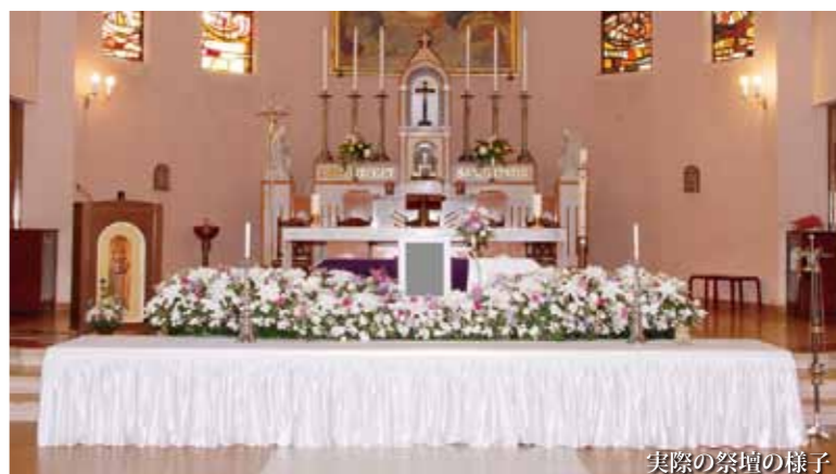
実際の祭壇の様子

いますが、仏教徒の方がお数珠を持って葬儀に來られて合掌されても、別に構わないと考えています。やはり国ごと、宗教ごとに文化がありますから。