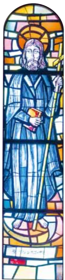
大聖堂内にあるステンドグラス