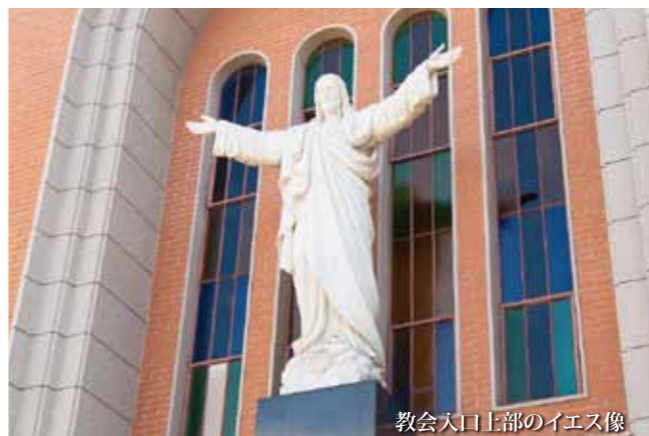
教会入口上部のイエス像