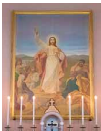
大聖堂内にある絵画